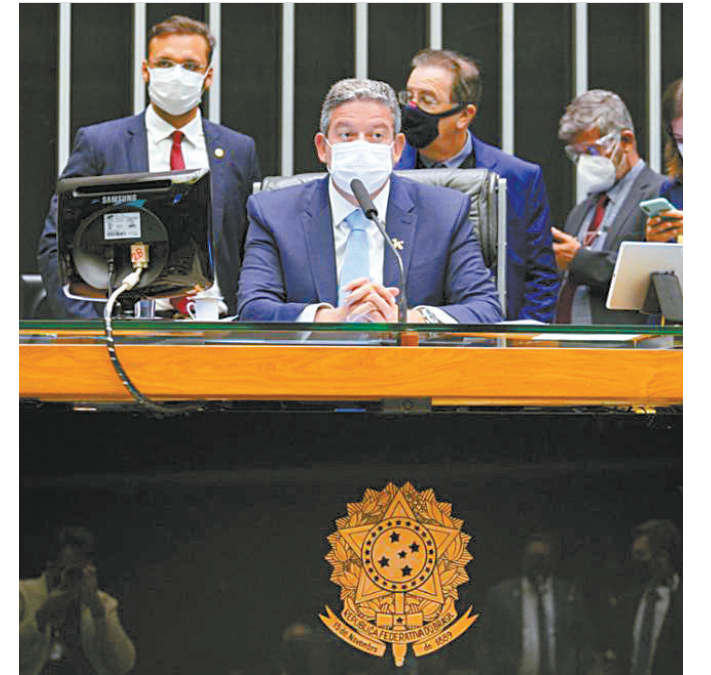
Presidente da Casa recebeu bloco contrário à PEC da reforma